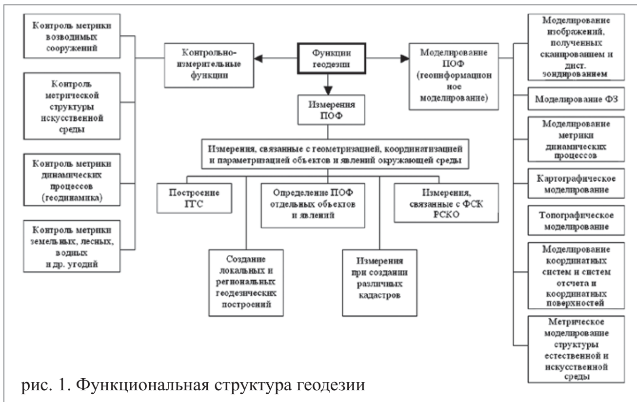
рис. 1. Функциональная структура геодезии

ПОФ – пространственные отношения и формы;